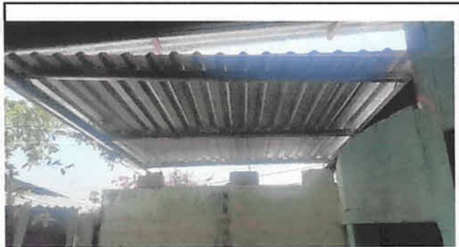
Foto 3: Cambio de lamina y madera por lamina troquelada y costanera